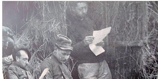
Documents 2 et 2bis